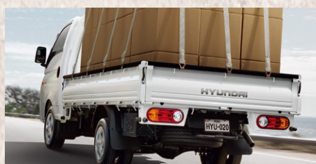
Capacidad sobre eje posterior: 1,920 kg Aros: 13" en posterior y 15" en delantero