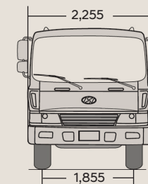
DIMENSIONES FRONTAL Y POSTERIOR